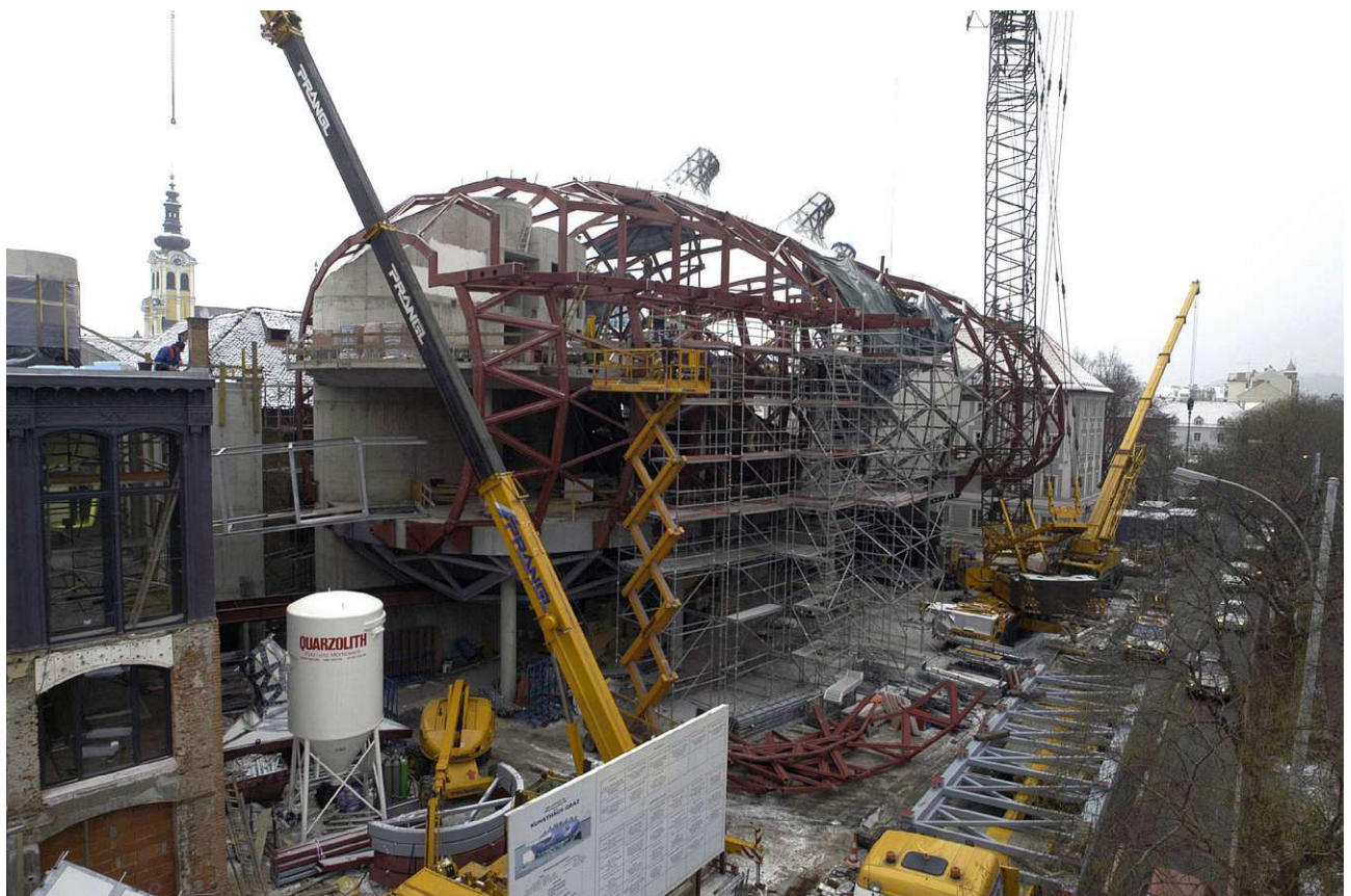
Abbildung 2: Stahlgerüst der Skin

Ein mediales Fassadenprojekt der Berliner Gruppe Realities:United macht das Kunsthaus auch im Dunkeln von außen gut sichtbar. Die sogenannte BIX-Fassade beleuchtet die Acrylplatten auf der Murseite mit ca 1000 Lichtringen von innen. Diese sind digital gesteuert und kommunizieren über bildliche und/oder textliche Darstellungen (keine Werbung!) mit der Umgebung vom Kunsthaus.