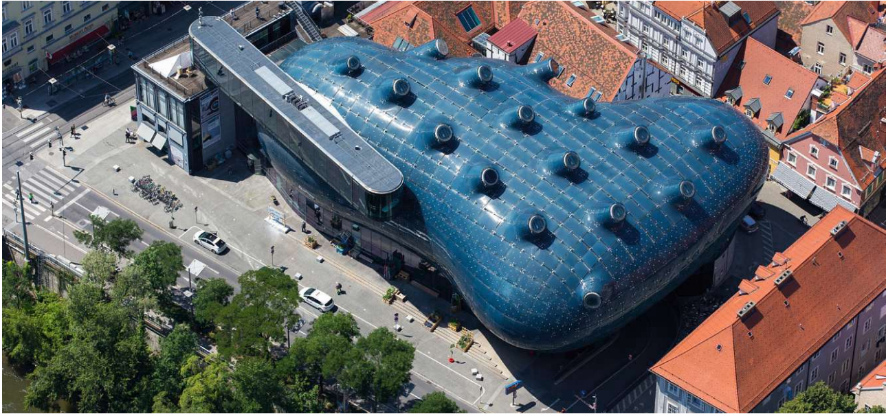
Abbildung 3: Das fertiggestellte Kunsthaus